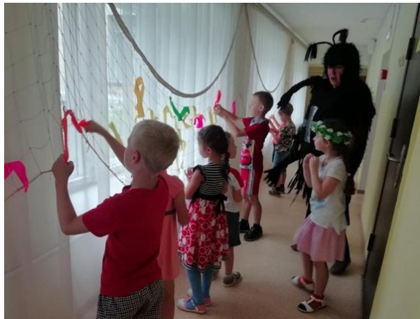
Праздник «Лесные дары Сибирского края»