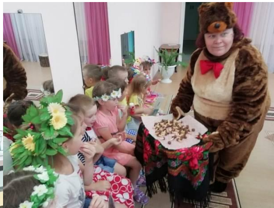
Игровая программа «Грибная полянка»