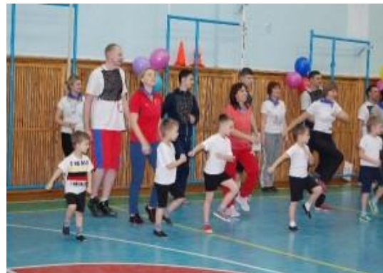
Соревнования «Мама, папа, я – спортивная семья»