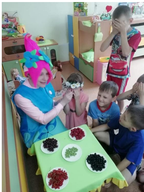
Праздник «Ягодное лукошко»