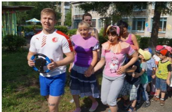
Праздник, посвященный Дню Отца «Супер -папы»