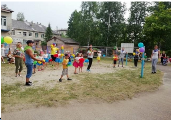
Праздник «День физкультурника»